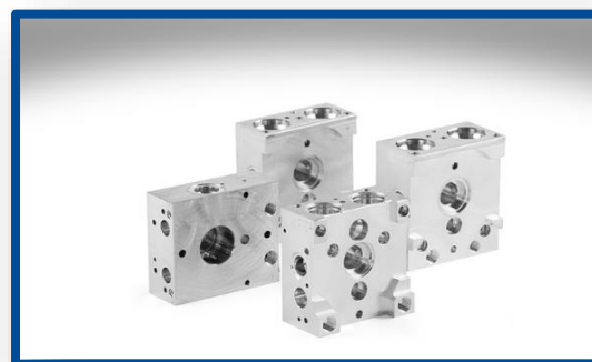
Blocul de supape metalic ABS